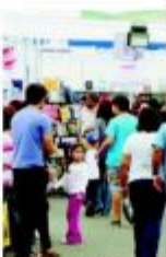
QUEDA UNA SEMANA MAS.

Además, destacó que en esta segunda versión, la feria logró evidenciar su etapa de consolidación como tal, siendo la segunda feria del libro más importante del país. "La instalación de una feria de esta envergadura obedece a instalar las bases de la proliferación de la industria editorial sustentable en el tiempo, rescatar a los escritores locales, generar puntos de ventas y llevarlos a Santiago", explicó.