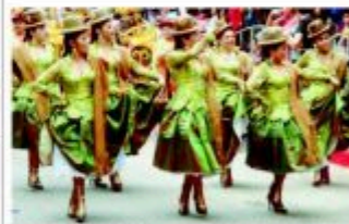
FILZIC TRAERÁ EL RITMO DE BOLIVIA A LAS CALLES DE ANTOFAGASTA.

La velada dominical concluyó con la presentación artística de la agrupación Danza Perfiles de América en el escenario central y posteriormente, se dio inicio a una fiesta folklórica altiplánica-andina con el grupo musical Punahue, que incorpora instrumentos étnicos, sinfónicos y contemporáneos en sus producciones. Una parrilla para todos los gustos.