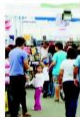
QUEDA UNA SEMANA MAS.